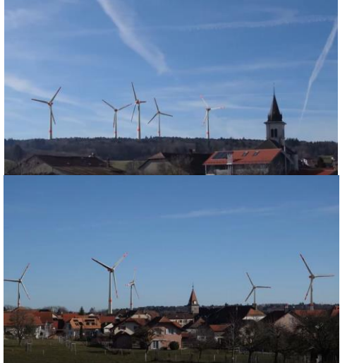
Photos du film : en haut, projet EssairVent depuis St-Oyens, en bas, projet de Bière depuis Bière