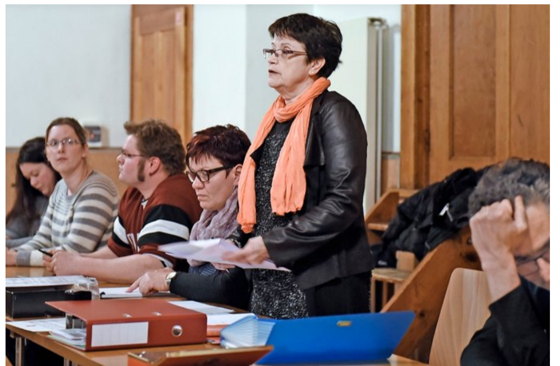
À Mont-la-Ville, les Conseils généraux des villages concernés, ici celui de Juriens, se sont prononcés sur le plan d'affectation du projet éolien. Seul La Praz l'a refusé. CHRISTIAN BRUN

Et dans la grande salle en bois où les syndics devaient se retrouver pour parapher le document final, on n'entend plus que le vent. Le vent qui a encore le culot de frapper aux fenêtres. E.L.B.