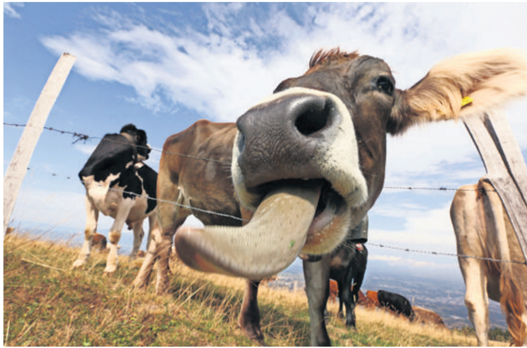
Non paisibles ruminants sont considérés comme des ennemis par les détecteurs. LUCIEN FORTUNATI