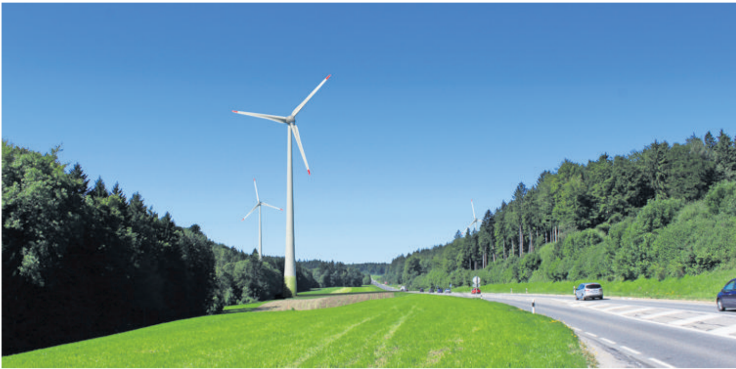
Les trois éoliennes les plus visibles depuis la route de Berne marqueront l'engagement de la Ville pour les énergies renouvelables.