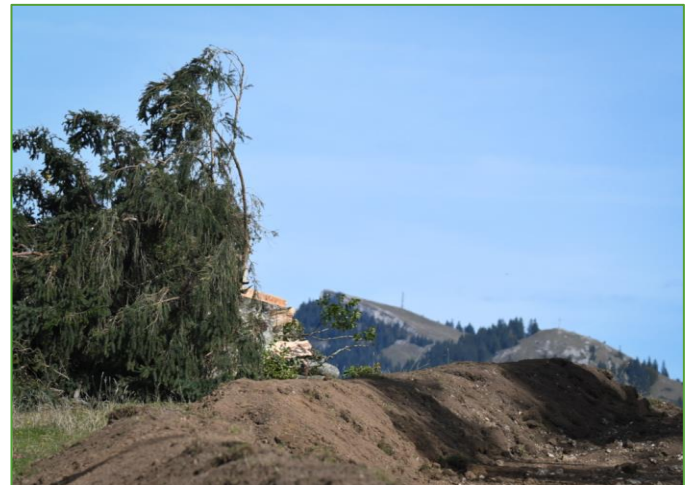
Mont-des-Cerfs 15.10.21

pour les amoureux de la nature qui sont sous le choc. Elle est aussi grande dans les autres régions menacées par la construction d'un parc éolien dans les paysages paradisiaques du Jura vaudois : Sur Grati, Mollendruz, Bel Coster, Vallée de Joux. Cette fois-ci, on commence à voir grandeur nature les dégâts provoqués par la construction de ces éoliennes aussi inutiles que coûteuses.