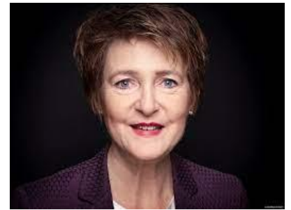
S. Sommaruga, cheffe du DETEC

S'il arrive souvent aux éoliennes de manquer d'air, ce n'est pas le cas de Simonetta Sommaruga. Dans un article de la NZZ am Sonntag du 9 octobre, repris peu après par le Temps , elle relaye sans sourcilier une proposition de son département (DETEC) qui affirme vouloir encore accélérer le développement des renouvelables en bouleversant les institutions.