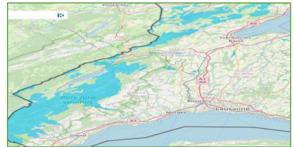
En bleu : zones à protéger pour ouvrir la carte cliquez sur l'image

Pas étonnant que les choix qui se posent aux décideurs amènent à des pesées d'intérêts totalement absurdes. Un bel exemple est le parc EolJorat Sud qui est prévu en plein milieu du futur parc naturel périurbain du Jorat . Cherchez l'erreur !