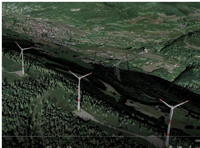
Extrait du film BelGraMo : ombres portées sur Vallorbe

Le film réalisé par Paysage-Libre Suisse et PLVD a été publié avant les fêtes. C'est aussi le plus long puisqu'il décrit la destruction prévue des paysages jurassiens concernés par les projets Bel Coster, Sur Grati et Mollendruz. Rappelons que ces trois projets sont en pleines procédures judiciaires vaudoises et fédérale.