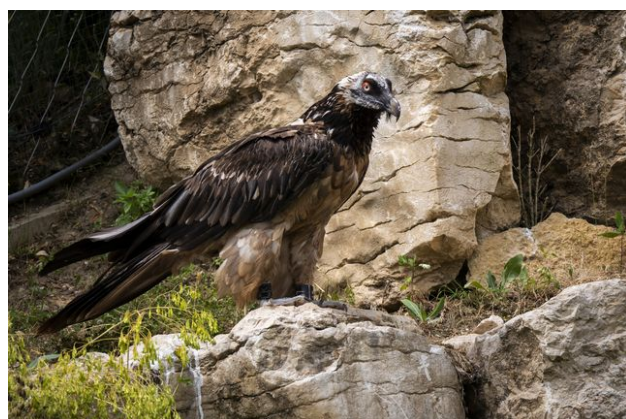
Un mâle gypaète barbu, photographié au zoo de La Garenne en 2019 (archive).

Les gypaètes barbus volent souvent bas, parce que les vents ascendants, utilisés par les oiseaux pour leur vol, sont particulièrement forts sur les pentes exposées au soleil, ainsi que sur les crêtes.