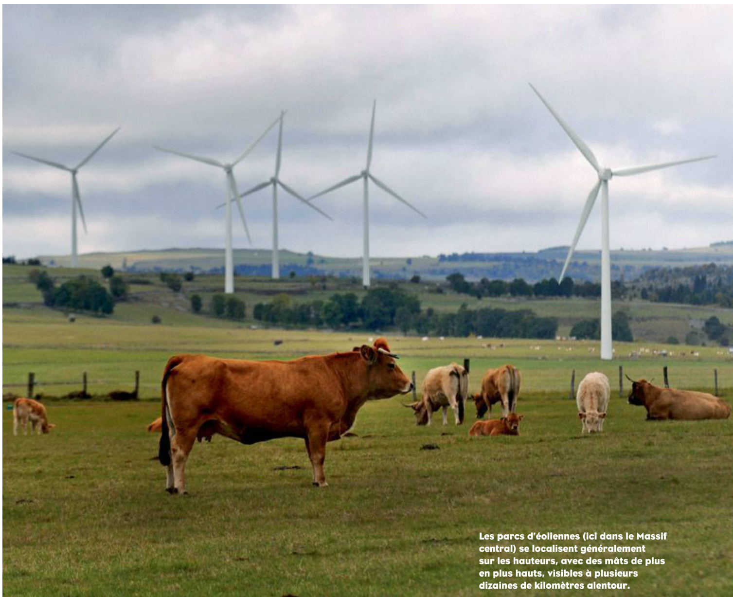
Les parcs d'éoliennes (ici dans le Massif central) se localisent généralement sur les hauteurs, avec des mâts de plus en plus hauts, visibles à plusieurs dizaines de kilomètres alentour.