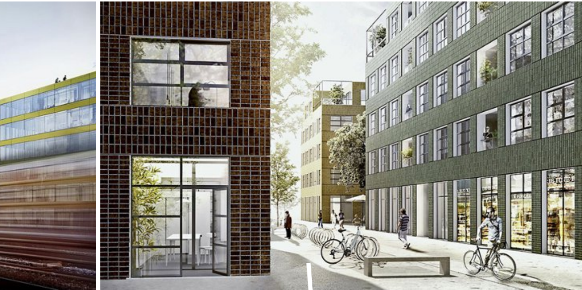
Les bâtiments de la partie ouest du quartier auront un petit air industriel.

ces et le siège romand des CFF: le puzzle s'assemble peu à peu