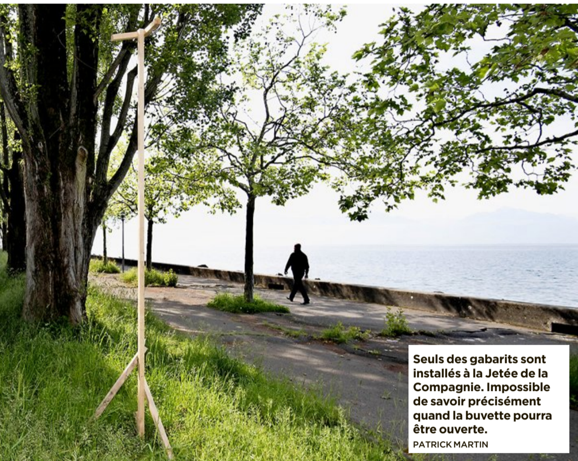
Seuls des gabarits sont installés à la Jetée de la Compagnie. Impossible de savoir précisément quand la buvette pourra être ouverte.