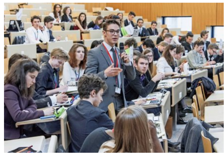
La session romande du Parlement européen des jeunes (PEJ) a réuni à Lausanne pas moins de 75 participants. FLORIAN CELLA

Assis en cercle et partageant leurs idées à coups de post-it, ils ressemblaient plus à des hippies modernes qu'à des parlementaires. Et pourtant la dizaine de participants constituait bien l'une des huit commissions de la session romande du Parlement européen des jeunes (PEJ), section suisse, qui s'est tenue ce week-end à Lausanne. L'événement a réuni