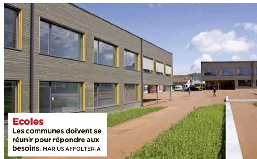
Ecoles Les communes doivent se réunir pour répondre aux besoins.