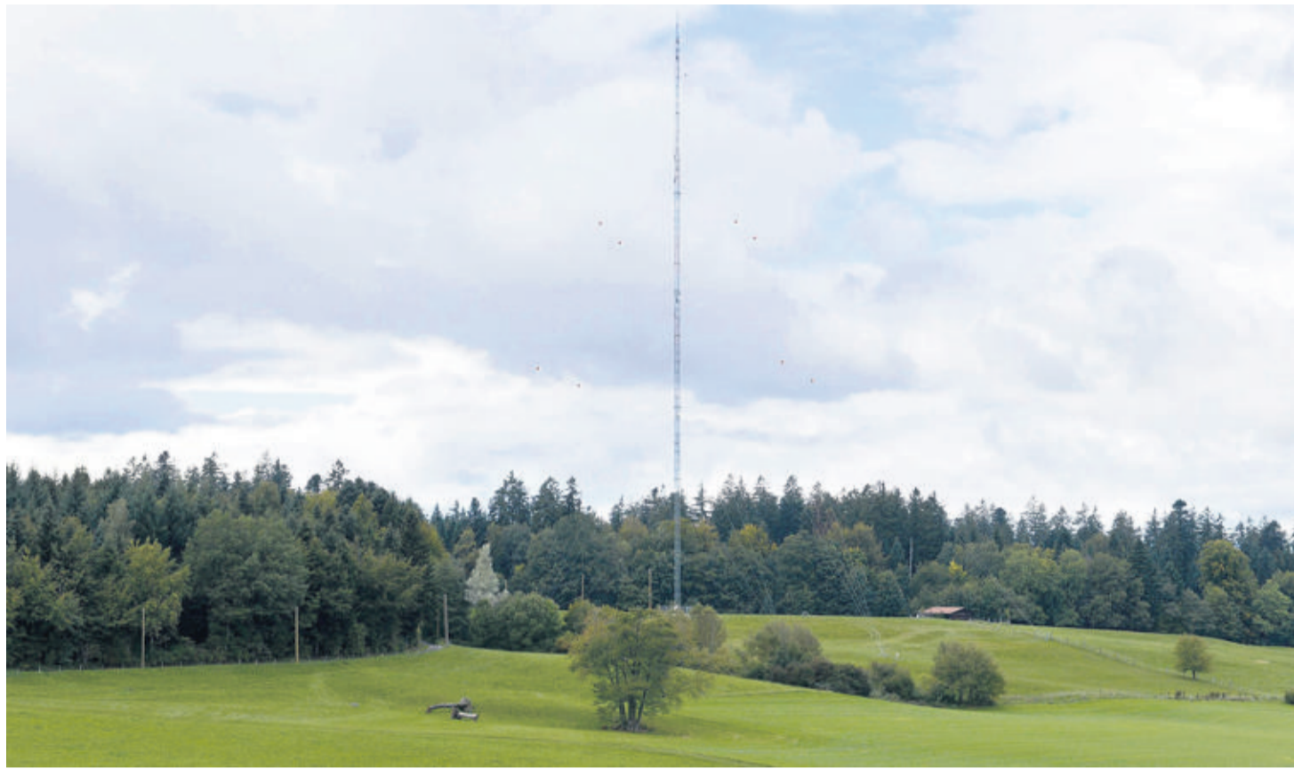
Le mât de 135 m érigé au Chalet-à-Gobet sert de gabarit visuel au projet. Il complétera les études de vent à cet endroit.