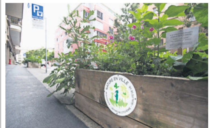
Les bacs de la rue Saint-Roch siglés «nature en ville». ODILE MEYLAN